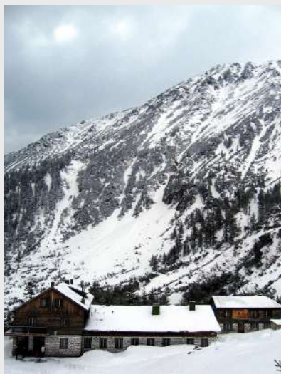
Planinarski dom Vihren

Iz Beograda polazimo u 20:00. Put Bugarske krenulo je 72 planinara, od toga najveći broj su učesnici škole visokogorstva. Pravimo kraće pauze i oko podneva stižemo u Bansko – turističko-skijaško mesto. Tu ostaje manja grupa planinara sledećih par dana, a mi nastavljamo dalje ka domu. Dolazimo do mesta odakle je malo teže nastaviti put autobusom i sledećih 9 km sa sve opremom prelazimo peške. Oko 15:00 stižemo u planinarski dom „Vihren“ koji je na nadmorskoj visini 1950 m.