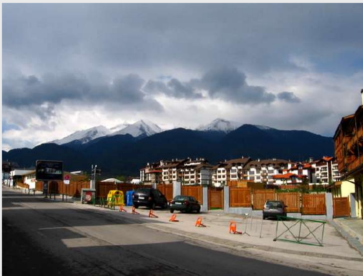
Bansko - pogled na Pirin

Planinski masiv Pirina nalazi se u jugozapadnom delu Bugarske. Nastavlja se na masiv Rile sa severa pa sve do grčke granice na jugu. Pirin je vododelnica egejskog i crnomorskog sliva. Sa istoka se proteže do reke Meste, a na zapadu do Strumice. Najviši vrhovi masiva su u Severnom Pirinu. Vihren (2914m) je najviši vrh i treći vrh po visini na Balkanu. Do 2000m je prekriven šumom. Iznad šumovitog dela je niže rastinje, livade i stene. Mnogobrojna glečerska jezera čine ovu planinsku lepoticu veoma privlačnom ljubiteljima prirode. Planinarske staze povezuju Pirin sa Rilom i grčkim planinama. U podnožju Pirina nalazi se Bansko, najlepše skijalište u Bugarskoj. Za vreme skijaške sezone Bansko ima deset puta više stanovnika.